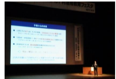
⑤電子黒板の整備率

そして、ICTを含めたインフラ環境の整備を図ることが重要であるとの指摘があり、参考資料として電子黒板の整備率が添付されました。佐賀県は76.5%で全国一位、27年3月末の全国平均は9.0%でした。